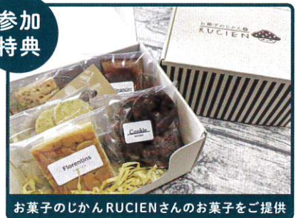
お菓子のじかんRUCIENさんのお菓子をご提供